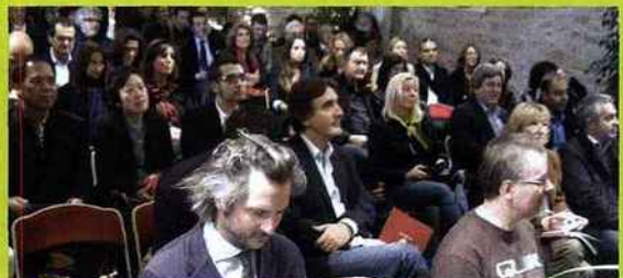
Ils sont venus de toute la France pour assister au lancement officiel de la Web TV sur la vigne et le vin.